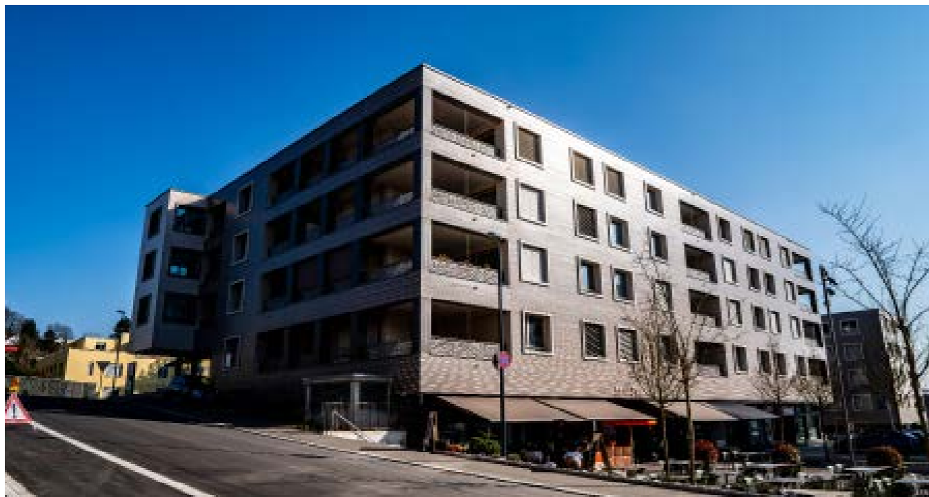
Projekt: Leuengasse, Leuenareal, Baufelder N+O, L+M, P1-3, 8142 Uitikon-Waldegg (16'000 m2)